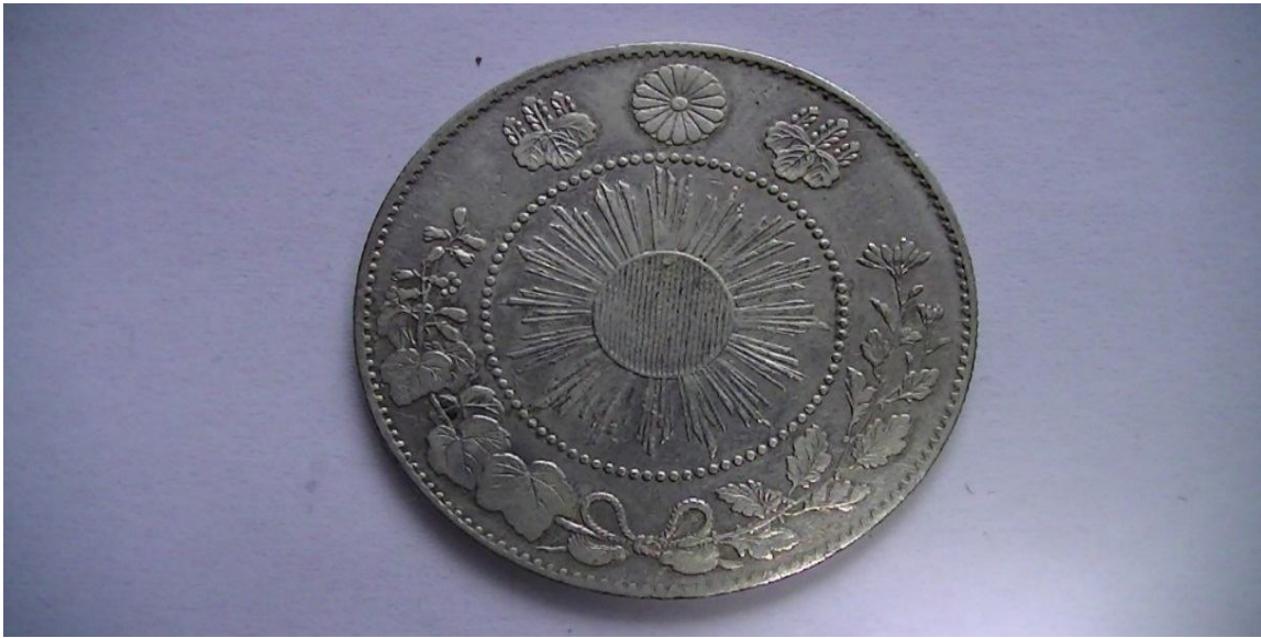
Серебряная монета 3 года Мэйдзи (1870) 14

В России во время реформирования денежной системы был введён советский рубль (золотой червонец), который пришёл на смену совзнакам, выпуск которых не был использован в должной мере для стабилизации денежной системы. Название «рубль» было возвращено валюте, но это была уже совершенно иная денежная единица, изолированная, как и вся страна, от мирового рынка, в которой деньги постепенно превращались из меры стоимости в средство учёта. В общем денежная единица отразила в себе специфику социальной системы, которая была изолирована от мирового хозяйственного организма. Тем не менее эффект стабилизации был таким же, как в Японии. Поэтому замена денежной единицы – важнейший элемент реформирования, который позволяет начать выход из кризисной ситуации и кардинально изменить экономику.