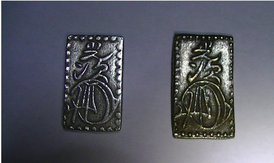
Золотая монета 2 бу годов Манъэн 12

было произведено в 1864–1867 гг. и могло достигать до 8–9 млн рё, не считая доходов от перечековки других видов монет. Соответственно общий объём бюджета в 1866–1867 гг., по самым скромным оценкам, превысил 10–12 млн рё.