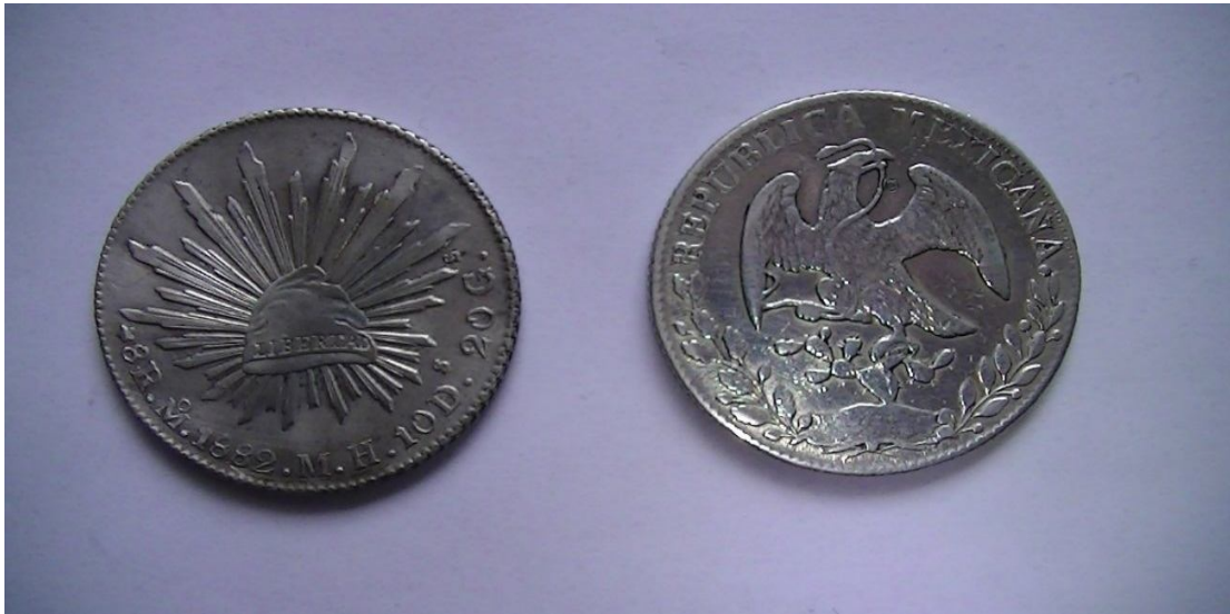
Мексиканский доллар 1

Внутри Японии в условиях изоляции от внешнего мира не существовало специальной монеты для внешнеторговых операций, на основе которой возможно было высчитывать стоимость всех остальных монет. Японская торговля в Нагасаки была очень специфической и в значительной степени скорее бартерной, чем денежной. Мексиканский доллар также не использовался в торговых операциях. «Открытие страны» и начало внешней торговли требовали регулярного использования денег, что повлекло необходимость привязать мексиканский доллар к одной из японских монет.