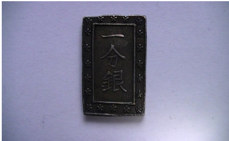
Серебряная монета 1 бу годов Тэмпо 4

быть равным японской серебряной монете 1 бу , весившей 8,6 г. Большая часть торговли неизбежно должна была вестись на основе серебра, поэтому такая диспропорция означала появление спекулятивной торговли в огромных масштабах 3 и явных преимуществ японской стороны. В итоге было принято решение приравнять мексиканский доллар напрямую к 1 серебряному бу годов Тэмпо на основе весовых параметров этой серебряной монеты и мексиканского доллара.